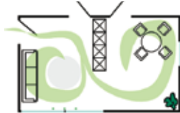
Energiefluss nach der Beratung: Das Chi verteilt sich im Raum, die so gewonnene Energie steht den Bewohnern zur Verfügung.